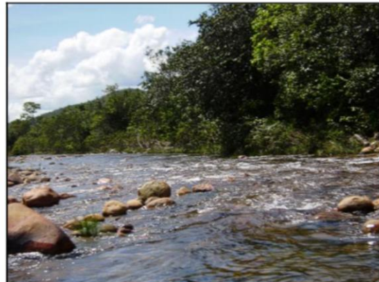
Figura 3: O Rio Corrente e seu leito rochoso. Autoria: M.G de Almeida, abril 2009.