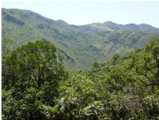
Figura 2: Relevo acidentado e vegetação de cerrado Autoria: M.G de Almeida, abril 2009.