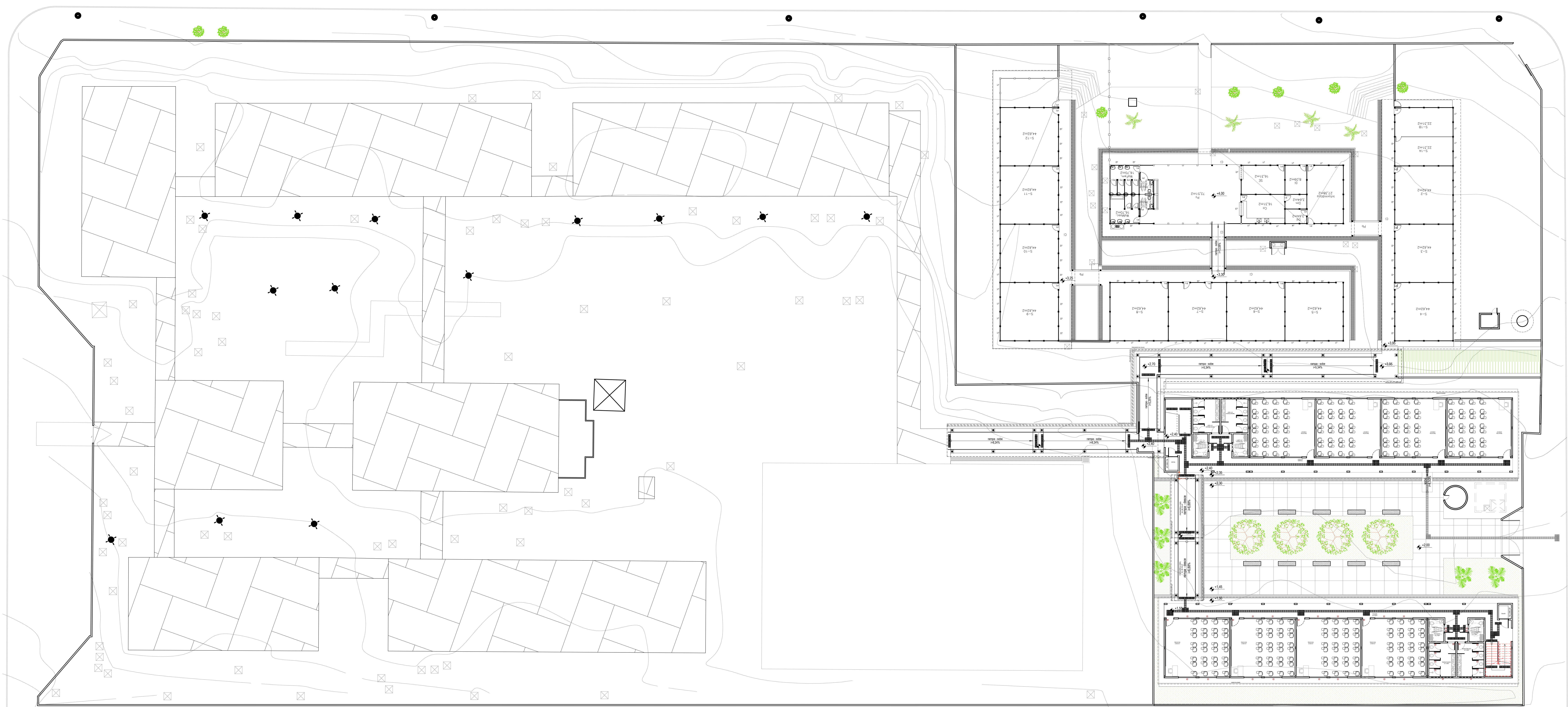
PLANTA DO TERREO - LAYOUT PROPOSTO ESC.: 1:150