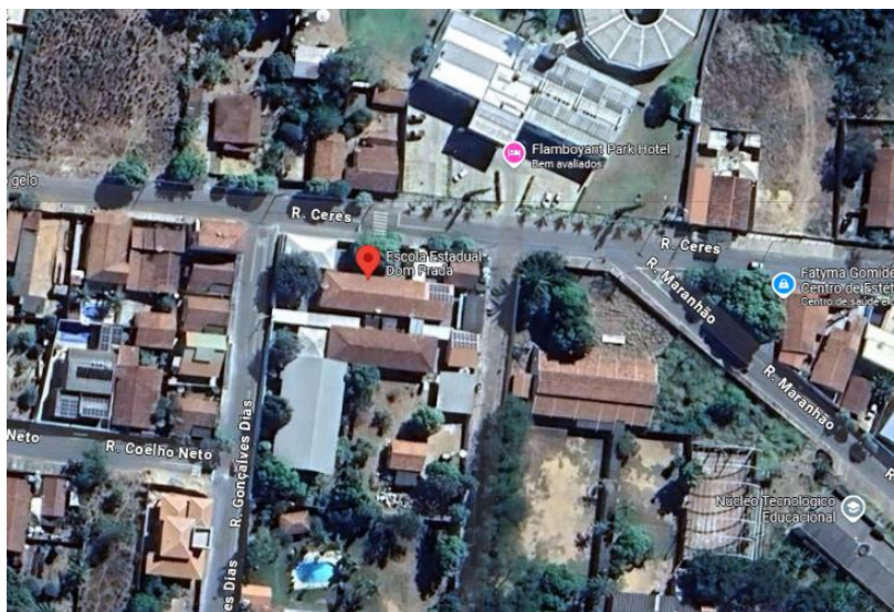
Figura 1- Google Earth

O presente projeto trata da estrutura do CEPI Dom Prada, em Uruaçu – GO, localizada na Rua Ceres, s/n, Centro, Uruaçu-GO, conforme ilustram as figuras 1 e 2.