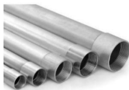
Figura 14 – Eletroduto Rígido.