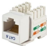
Figura 10: Conector fêmea CAT6