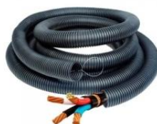
Figura 13 – Eletroduto Kanaflex PEAD.