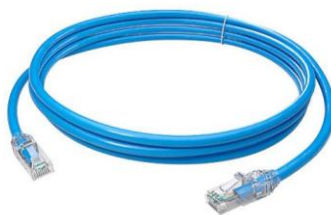
Imagem 09: Patch Cord