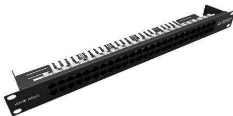
Figura 5: Voice Panel