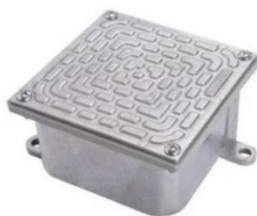
Figura 11 – Caixa de passagem de piso

Caixa de passagem fabricada em alumínio, com tampa reversível (lisa e antiderrapante), fixadas com parafusos com tratamento especial e junta de vedação, grau de proteção IP-65. Aplicada na montagem de equipamentos elétricos em geral e outras ligações em ambientes úmidos e com emissão de gases não inflamáveis, utilizada para instalações industriais e com tampa lisa para pátios, ruas, calçadas, etc.