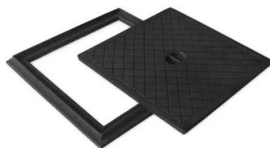
Figura 12: Caixa tipo R-1.

A caixa tipo R-1 pré-moldada deverá ser fabricada conforme os requisitos estipulados pela NBR-9062: Projeto e execução de estruturas de concreto pré-moldado e NBR-16085: Poços de visita e inspeção pré-moldados em concreto armado para sistemas enterrados – Requisitos e métodos de ensaio . Essas caixas são destinadas à instalação em calçadas, jardins, praças, entre outros locais, onde não há tráfego de veículos. No fundo da caixa tipo R-1 pré-moldada, deve-se deixar uma abertura com diâmetro de 30 cm para permitir a drenagem da água que possa infiltrar na base.