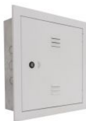
Figura 6: Distribuidor Geral de Telefonia - DGT

O Distribuidor Geral de telefonia (DGT) concentra os cabos provenientes da área externa do edifício e das empresas de telecomunicações e concessionárias, é o distribuidor de linhas e ramais. A entrada telefônica deverá ser subterrânea até a sala em que o DGT for instalado, onde ocorrerá a conexão do cabo da concessionária com a rede do edifício. Deverá ter número de canais compatíveis com os pontos de telefonia que serão previstos no projeto executivo.