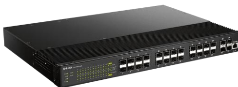
Figura 4: Switch gerenciável