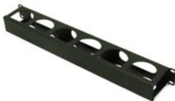
Figura 2: Guia de Cabos