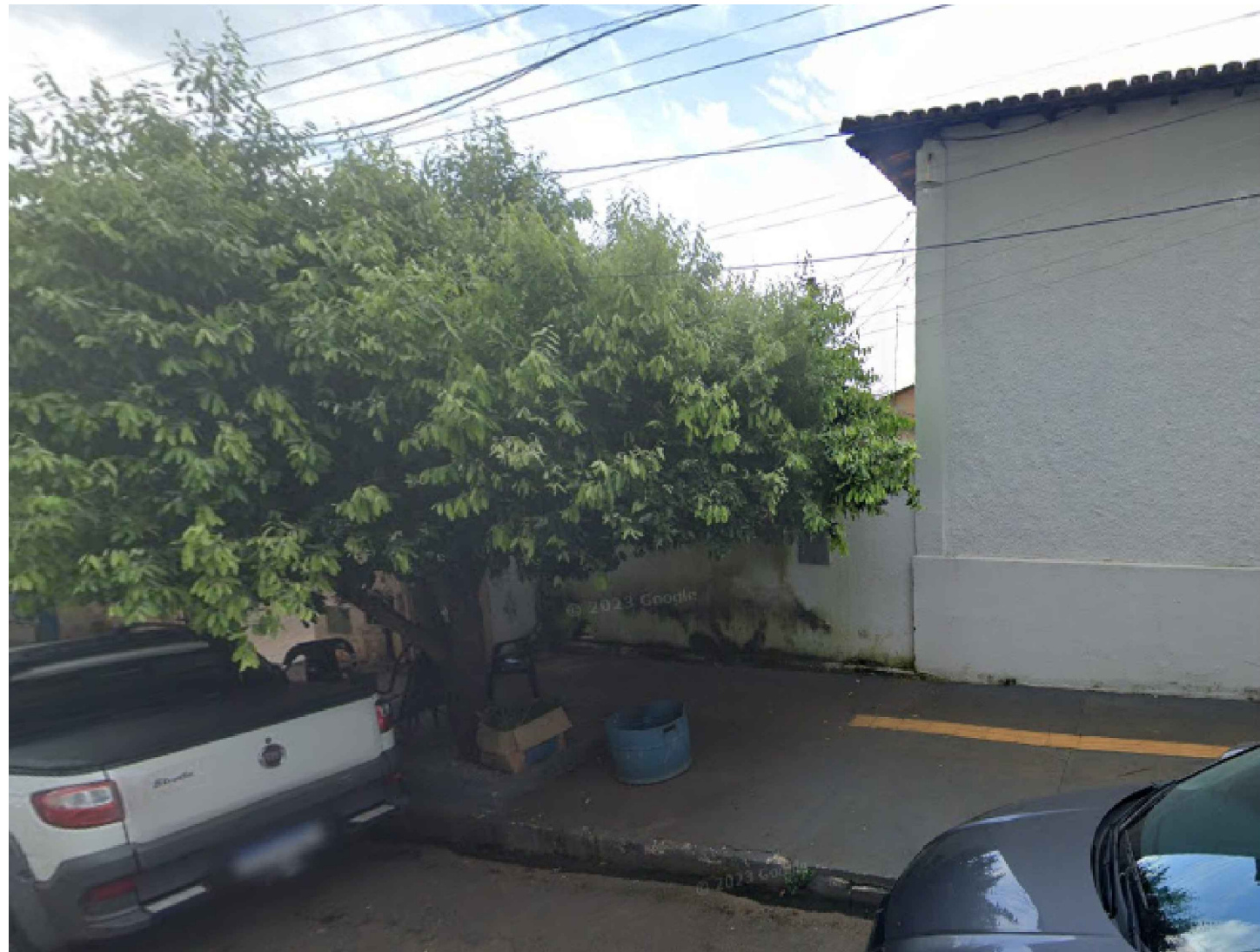
LOCAL A SER IMPLANTADA A SEE (VISTA EXTERNA) Escala - sem