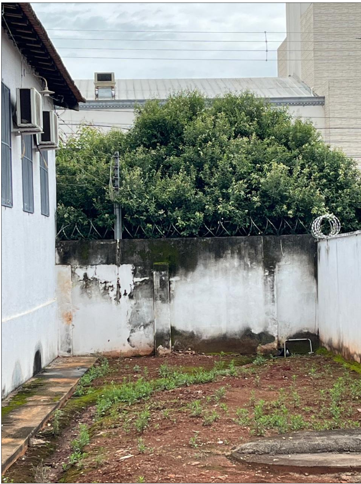
LOCAL A SER IMPLANTADA A SEE (VISTA INTERNA) Escala - sem