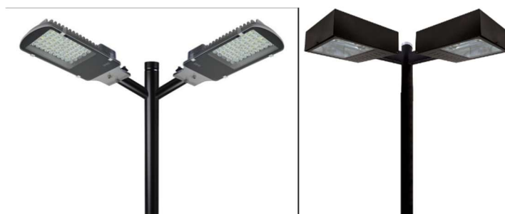
Figura 03 – Poste com luminárias LED.