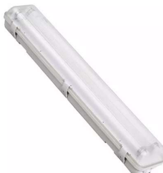
Figura 04 – Luminária hermética/blindada com duas lâmpadas LED 1,2m de 18W