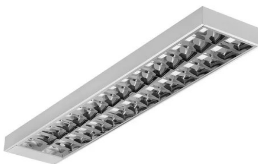
Figura 02 – Luminária de sobrepor, com aletas de alumínio e duas lâmpadas LED 1,2m de 18W.