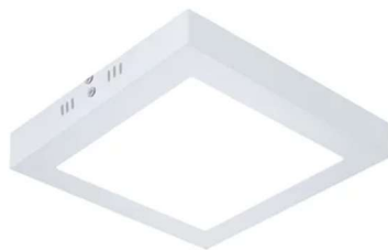
Figura 01 – Luminária de sobrepor, tipo plafon quadrado com LED 12/13W.