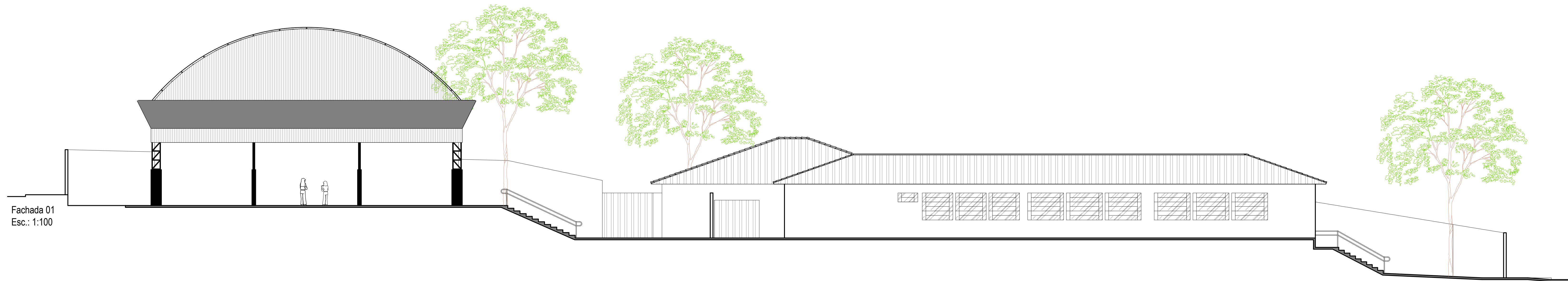
Fachada 01 Esc.: 1:100