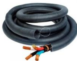
Figura 11 – Eletroduto Kanaflex PEAD.