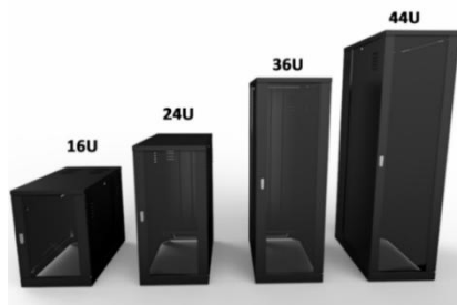
Figura 1: Rack Telecomunicações