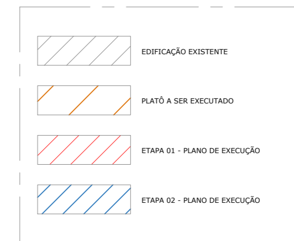
LEGENDA SEM ESCALA