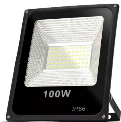
Figura 02 – Refletor de LED 100W.