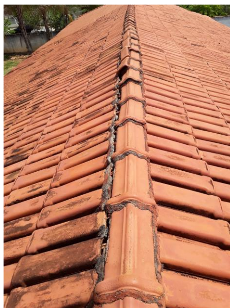
Figura 02 – Escorregamento das telhas devido à elevada inclinação.

A reforma dos banheiros se justifica pelo bem-estar dos alunos. A revitalização dos banheiros trará mais conforto a seus utilizadores. Outro elemento motivador é o fato de que parte da tubulação é bastante antiga e constituída por material metálico. Desse modo, faz-se necessária a execução de novas instalações hidrossanitárias. Ademais, é importante adotar soluções no sentido de se realizar adaptações de acessibilidade da edificação. Para isso, serão construídos dois banheiros acessíveis.