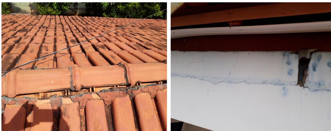
Figura 01 – Telhas cerâmicas e madeiramento.

A presente contratação justifica-se devido à urgente necessidade de se reformar o telhado de um dos blocos da unidade escolar. Observa-se que possivelmente devido à elevada inclinação, houve um escorregamento das telhas. Além disso, é possível notar que o madeiramento de um trecho pode ter ocasionado a fissuração